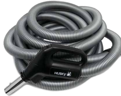
Fig.1 Boyau à technologie basse tension

» VALABLE POUR TOUS LES MODÈLES D'UNITÉ MOTRICE : afin de réduire les risques de surchauffe, faites en sorte qu'un espace minimal de 30 cm (12") sépare l'avant, le fond et les parois de l'unité motrice de tout obstacle.